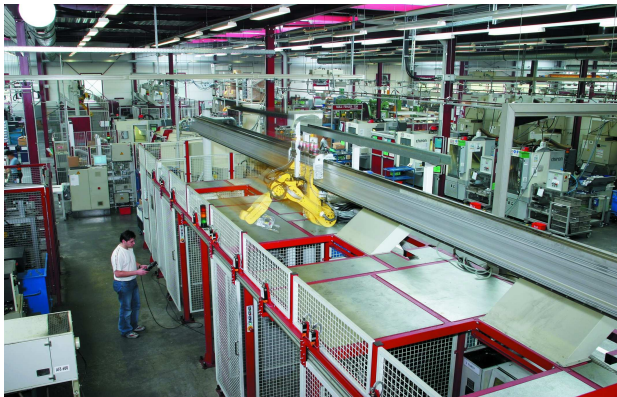
Moderne Fertigungsanlagen sorgen für höchste Qualität