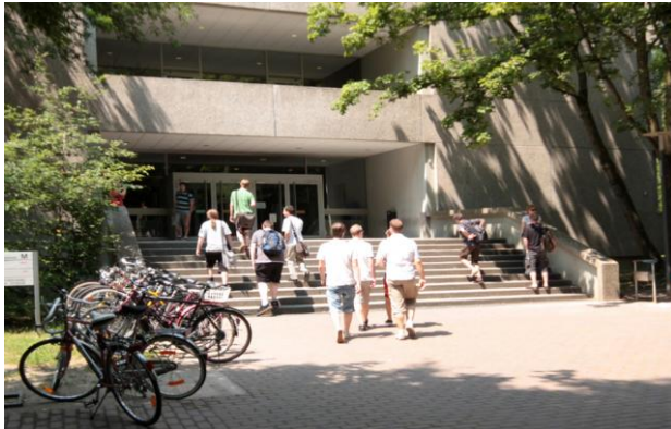
Die Fakultät für Informatik und Wirtschaftsinformatik (IWI)