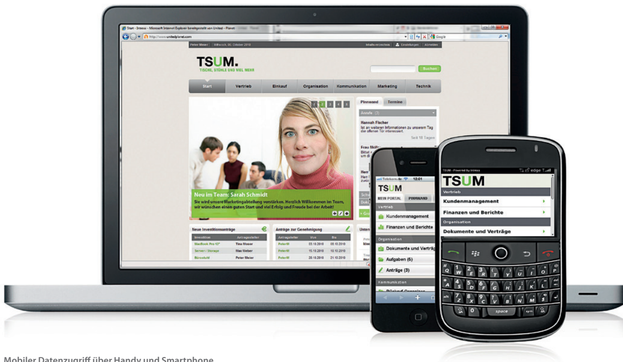
Mobiler Datenzugriff über Handy und Smartphone