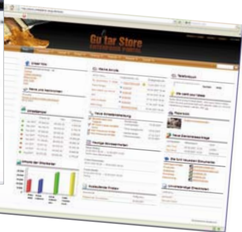
Startseite eines Portals

wenigen Monaten um. Dabei haben sie klare Zielvorgaben: Die Reduzierung der internen Organisationskosten, eine Steigerung der Produktivität oder die Einbindung ihrer Kunden und Lieferanten stehen für die Mittelständler an erster Stelle“, so Linser.